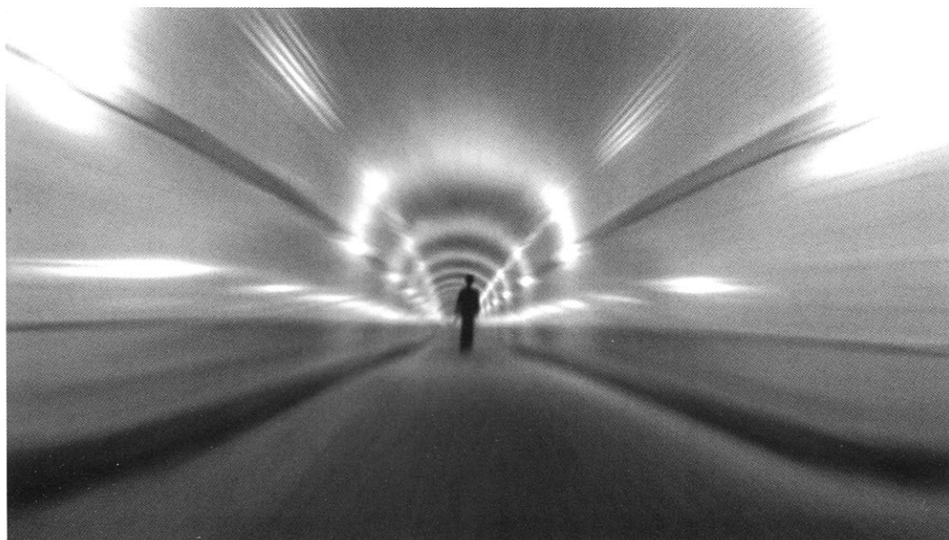
Bianco & Valente, Landungs , 2003.

tono felicemente con la “pittura” (senza dubbio quella americana degli anni Cinquanta). E questo è un modo sicuramente “diverso” di porre il problema dell'autoreferenzialità del lavoro al femminile. Infatti essa arriva a dare vita col filo ad una costruzione segnica caotica, e talora sequenziale, che attende un nostro sguardo affettivo per diventare armonica. Queste tele, apparentemente legate a un decor di superficie, in effetti nascondono immagini erotiche, magari prese da riviste, cosicché il ricamo sembra da un lato confondere, più o meno inconscie, visioni proibite, ma che in verità ci conducono ad una riflessione sul senso, sui luoghi comuni da sfatare, legati alla donna d'oggi che, anela ancora a vivere gli istanti del desiderio, anzi chiede, con determinazione di essere amata.