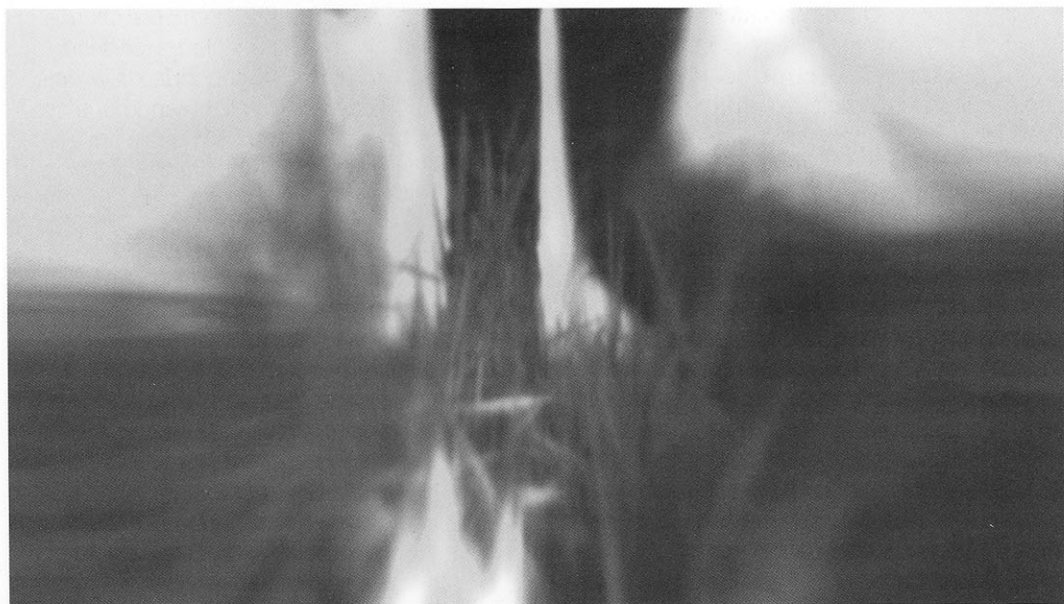
Bianco & Valente, Cloud System , 2003.

golo, portano però con sé tracce ancor più complesse dell'identità che ci costituisce. L'identità è dunque un'"avventura": il prodotto di una storia, e, spesso, un progetto per il futuro, un momento forte nel gioco dialettico che lega l'uno agli altri. Non c'è dubbio che vedere dall'alto le culture mediterranee, riconoscendone variazioni e invariazioni, ha alimentato la prospettiva globale. Certo là dove si è lavorato per creare situazioni in cui gli "oggetti culturali" di ogni artista potevano essere evocati e coesistere nella loro diversità, si evidenziano un sapere interstiziale, capace di convocare molteplicità e di farle interagire, e di prefigurare quindi quella prospettiva multiculturale che è di necessità molteplice e collettiva.